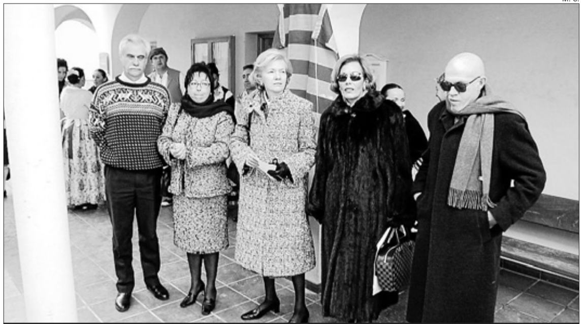
Familiares de la alcaldesa en el homenaje que le tributó Quatretondeta